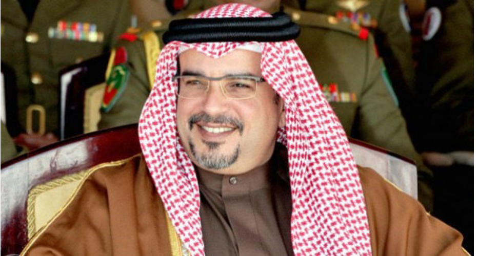
رئيس الوزراء الموقر صاحب السمو الملكي الأمير سلمان بن حمد بن عيسى آل ولي العهد نائب القائد الأعلى

أصدر العاهل البحريني الملك حمد بن عيسى آل خليفة، بتاريخ 12 نوفمبر 2020م أمراً ملكياً بتعيين ولي العهد نائب القائد الأعلى الأمير سلمان بن حمد بن عيسى آل خليفة رئيساً لمجلس الوزراء. وبهذه المناسبة يزف جميع أعضاء جمعية الإداريين البحرينية أسمى آيات التهنئة لسموه وتمننين له دوام الصحة والعافية والتوفيق وسائلين الله العلي القدير أن يديم على القيادة الحكيمة وافر الصحة والعافية وأن يحفظ مملكة البحرين والأمة العربية والإسلامية بحفظه ورعايته.